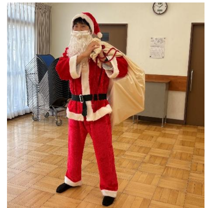
サンタクロース衣装

ヒモでつながっている2個のボールをラダー（ハシゴ）に向かって投げ、ボールがラダーに引っ掛かると得点となるゲームです。