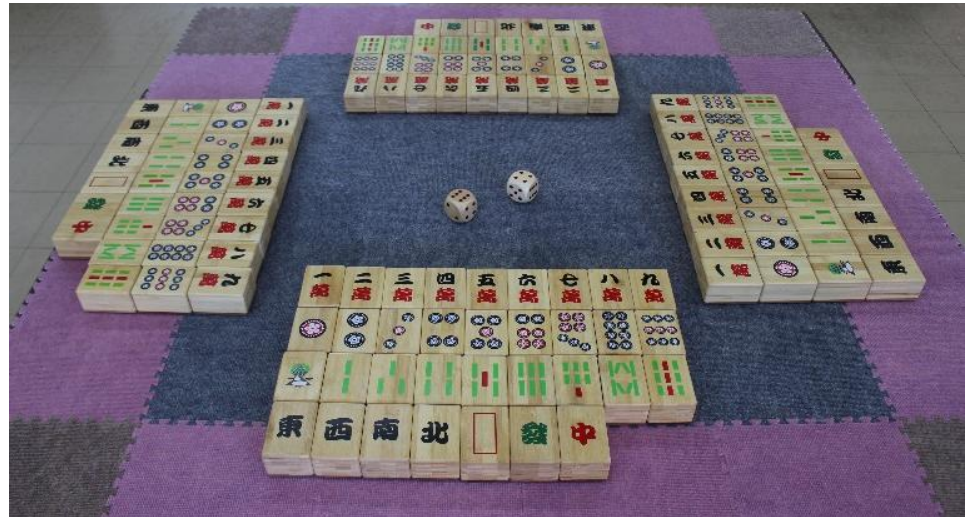
コミュニケーション麻雀

2人1組または3人1組、合計8~12名で相談しながら楽しむ、新たなスタイルの麻雀です。チームで進めるので自然とお喋りができます。使用する牌の大きさは『タワシサイズ』で、卓も180cm×180cmの大きさです。