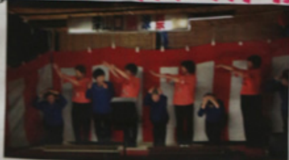
ピタゴラスイッチ