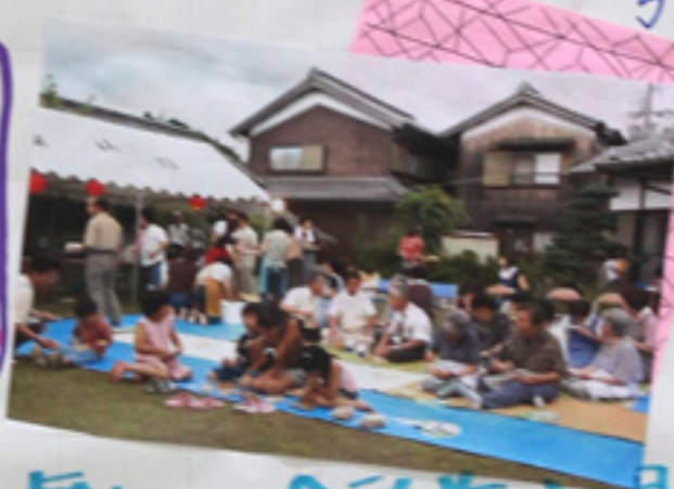
舞台は、会所前広場 2年前... 台風でもやりました!!