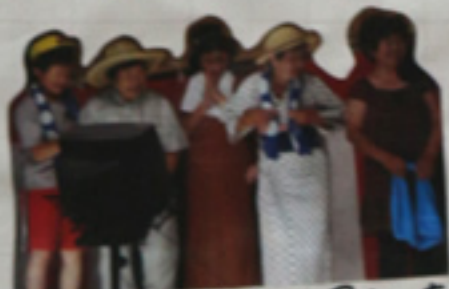
大きい(身長の)お母さんたち なんでもやります。