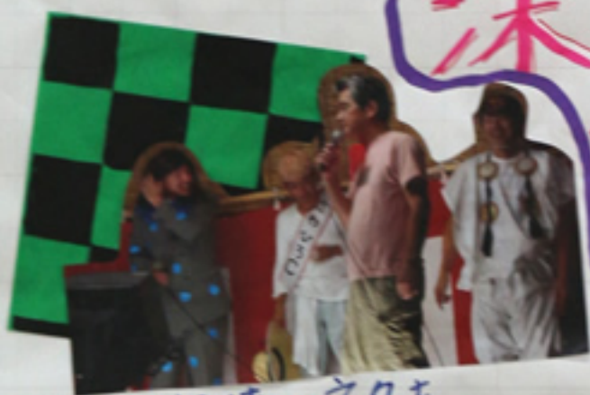
毎年期待のネタをやてくれます。