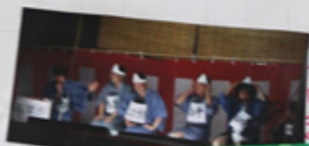
毎回体を はたして、楽し めてお可。