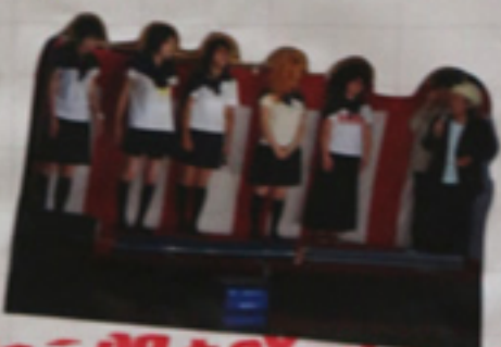
セー服を脱がさないで ねっ♡