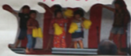
現在この子たちは... 高校生、大学生、社会人...