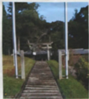
フリコにて 選んだ階段