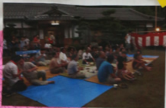
ステージ大女子キ らびっこショー