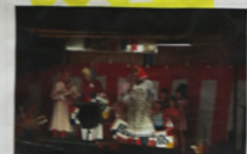
高原列車は テラテララン中〜よ〜