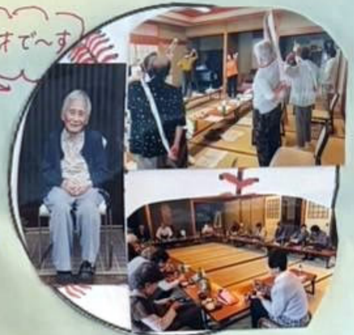
いきいきサロン 月一回