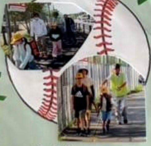
通学ボランティア