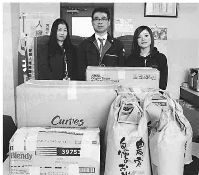
▲カーブスフレンドタウン日野店様