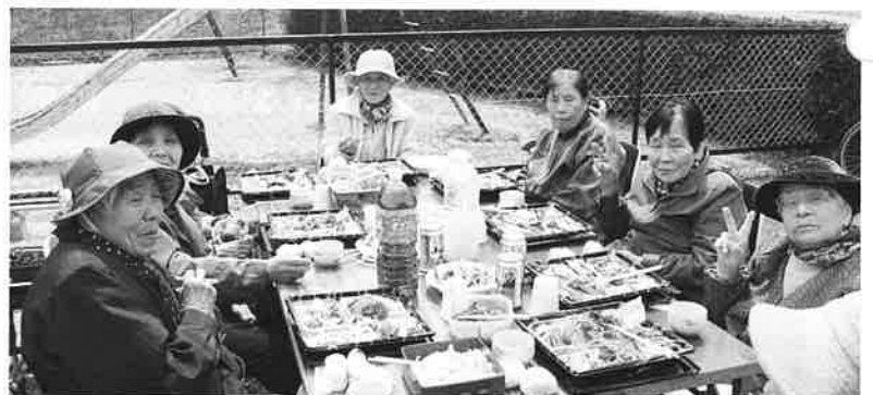
4月12日（金）川原ふれあい福祉会で“お花見サロン”を開催されました。